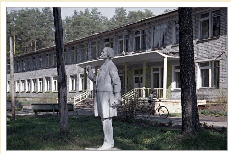
Фото главного входа в школу в Каринторфе