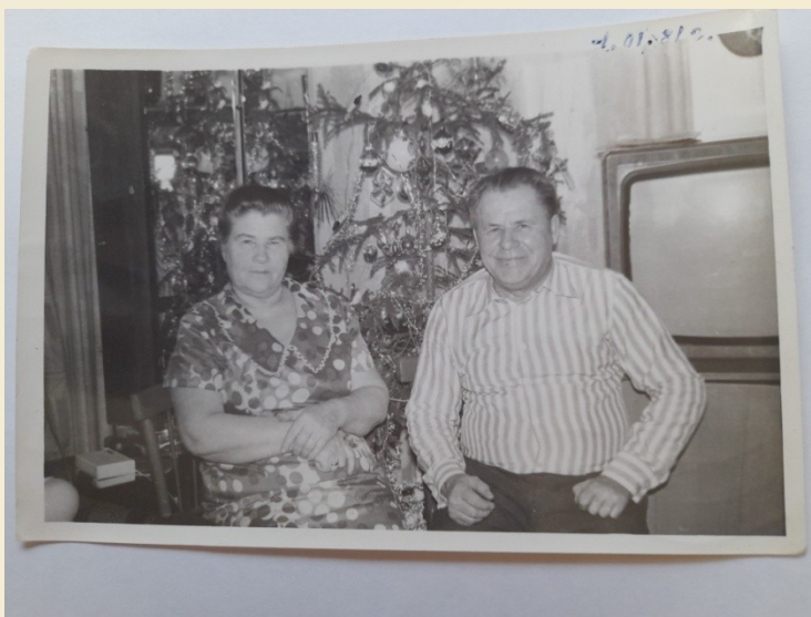
Августа Ивановна с супругом